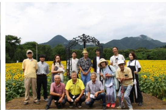
見晴らし台のある煙山ひまわりパーク