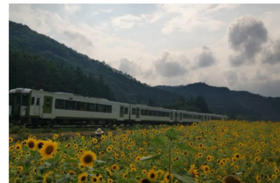
列車とひまわりと夕日の上郷地区