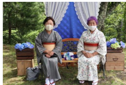
フォトスポットで撮影