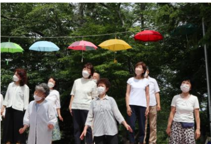
合唱した館山唱歌校の皆さん