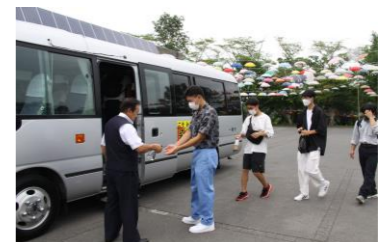
消毒をしていざ出発!

どちらも立地を生かしていることに参加者は「ほかの場所をみると刺激になる」と話していました。