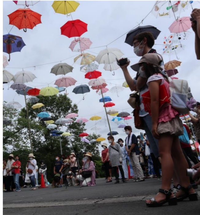
たくさん集まった傘と来場者