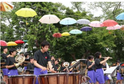
千厩中学校吹奏楽部の皆さん