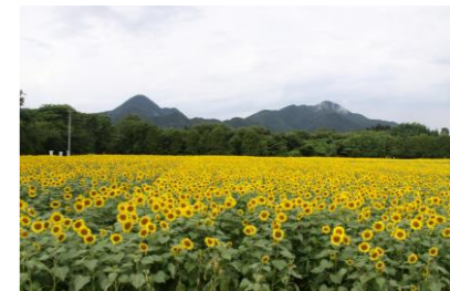
広ーい! 煙山ひまわりパーク