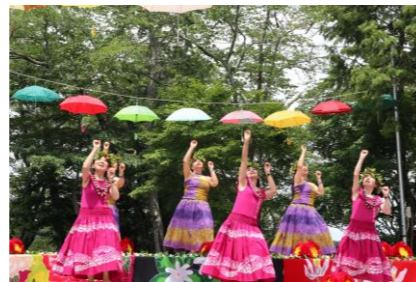
フラハウオリさん