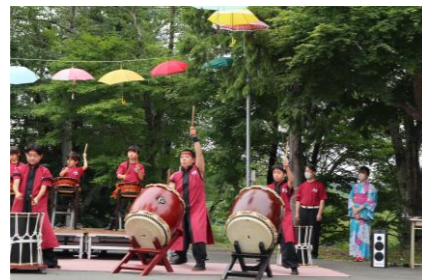
千厩八幡太鼓の皆さん